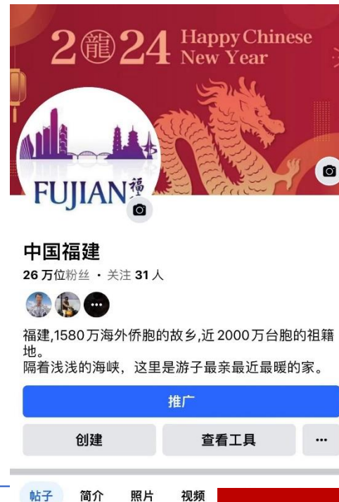
海外频道同步直播